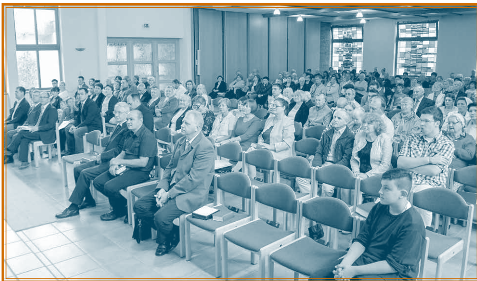
Teilnehmer der Geistlichen Rüsttage