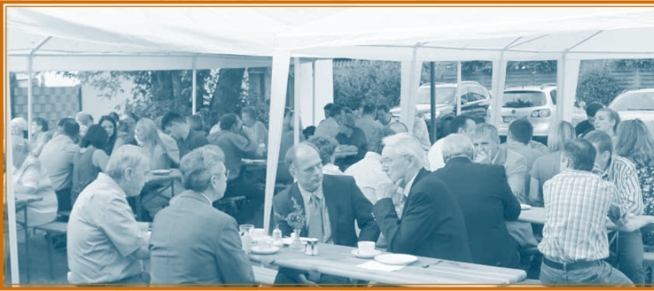
Gemütliches Beisamensein in der Pause

hatte. Man traf Brüder und Schwestern, die man länger nicht mehr gesehen hat und so war die Freude über das Wiedersehen sehr groß. Nach dem gemeinsamen Gottesdienst am Sonntag und dem Mit-